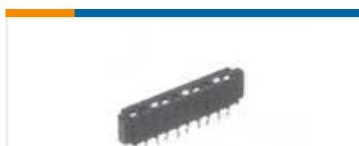
TE 产品编号5-520315-3 TRIOMATE ASSY V 3P L=3.556LDFR