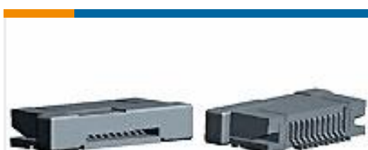
TE 产品编号2-1734592-9 FPC CONN. 0.5MM PITCH B/C, 29P