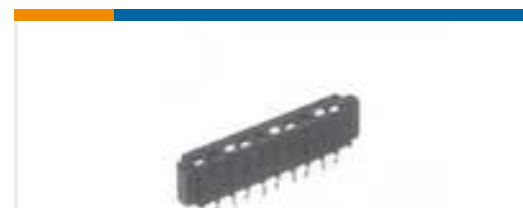
TE 产品编号5-520315-3 TRIOMATE ASSY V 3P L=3.556LDFR