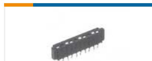
TE 产品编号5-520315-3 TRIOMATE ASSY V 3P L=3.556LDFR