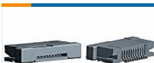
TE 产品编号2-1734592-9 FPC CONN. 0.5MM PITCH B/C, 29P