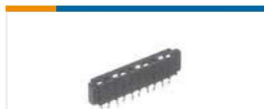
TE 产品编号5-520315-3 TRIOMATE ASSY V 3P L=3.556LDFR