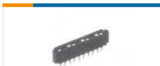
TE 产品编号5-520315-3 TRIOMATE ASSY V 3P L=3.556LDFR