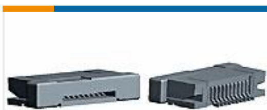
TE 产品编号2-1734592-9 FPC CONN. 0.5MM PITCH B/C, 29P