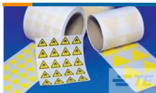
TE 产品编号 4-1768017-6 EET-0615P-4