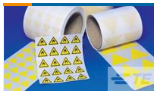
TE 产品编号 3-1768017-5 EET-0538P-4