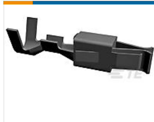
TE 产品编号927770-3 JPT REC 2.8 Contact SWS Sn