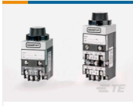
TE 产品编号4-1423161-8 7014RHA2I2=RLY,STD,ON,4P,60V,30M, A2,I2