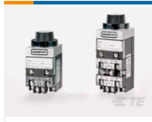
TE 产品编号8-1437487-6 7012ODILL=24V DC 5-50 SEC