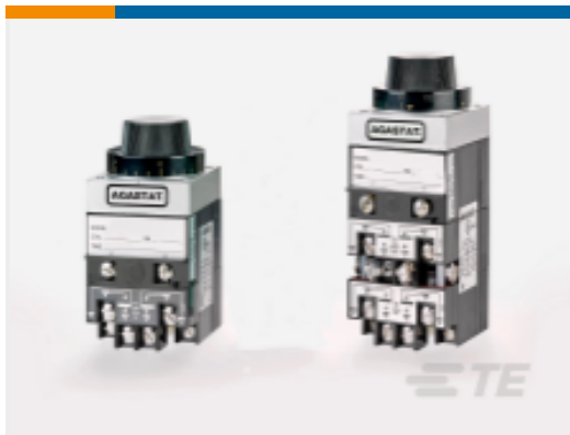
TE 产品编号 2-1423157-4 7012AK=RLY,STD,ON,2P,120VAC,30