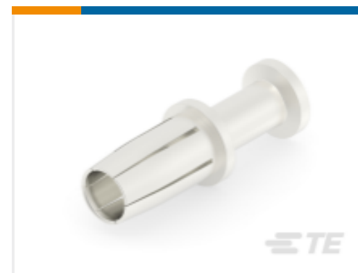
TE 产品编号T2400032100-002 HSF-10(10 sq mm),HIGH MATING CYCLES