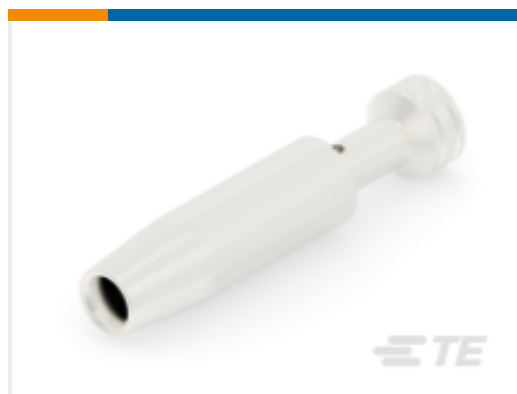
TE 产品编号T2030032008-000 HEF-0.75