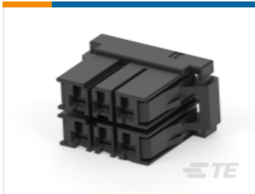
TE 产品编号1-1747414-3 Receptacle and Tab Housing: 6.35 mm pitch, 600V