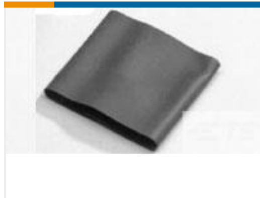
TE 产品编号389957J001 V2-3.0-0-SP-SM