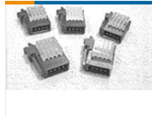
TE 产品编号4-1473562-3 RITS CONN. PLUG ASSY 3P GREEN