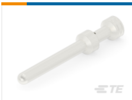
TE 产品编号T2030031008-000 HEM-0.75,L=28