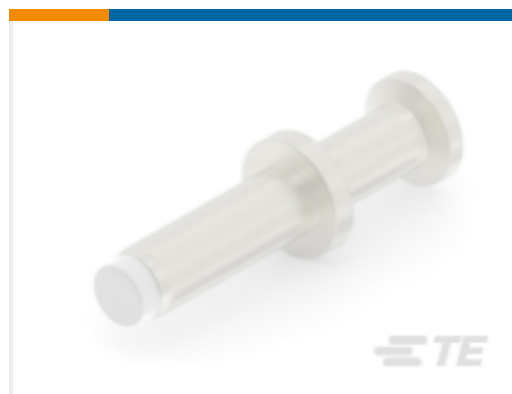
TE 产品编号T2400031100-002 HSM-10 with cap(10 sq mm)