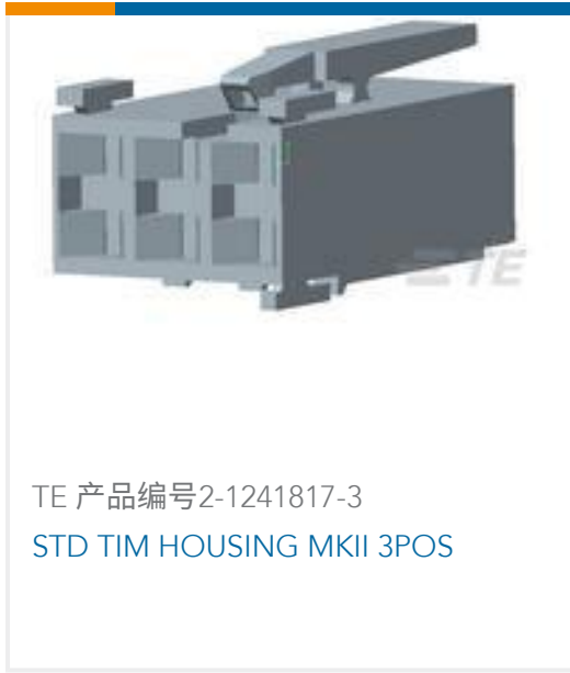
TE 产品编号2-1241817-3 STD TIM HOUSING MKII 3POS