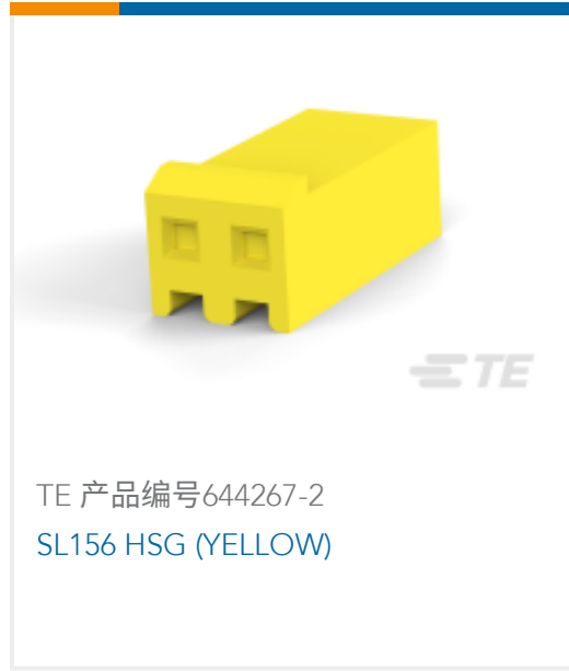
TE 产品编号644267-2 SL156 HSG (YELLOW)