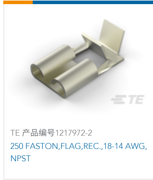
TE 产品编号1217972-2 250 FASTON, FLAG, REC., 18-14 AWG, NPST