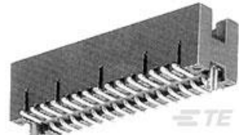
TE 产品编号5-104655-1 10 50/50 HDR DRST SFMNT TIN