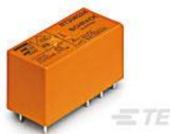
TE 产品编号1419108-6 RT214730