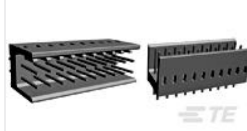
TE 产品编号826469-6 2X6P MOD II SHROUDED HEADER, ST