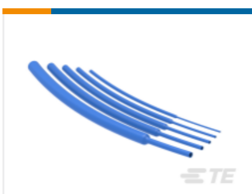
TE 产品编号NB23804001 VERSAFIT-3/8-6-SP