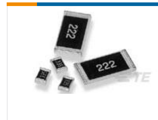
TE 产品编号3-2176067-2 CRG0201 1% 44R2