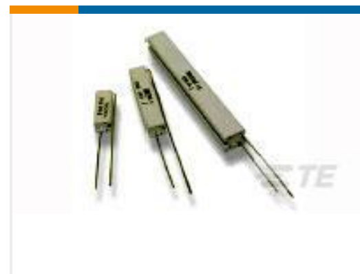
TE 产品编号1-1623726-0 SBCH 6 1R0 5%