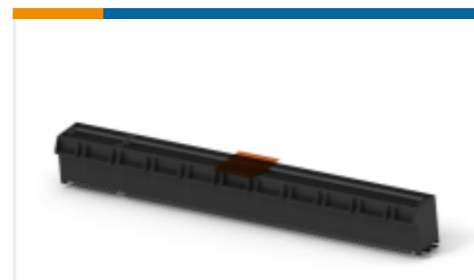
TE 产品编号 5-2337939-4 PCIE GEN4 CON,SMT,164POS,30u", MYLAR,HT