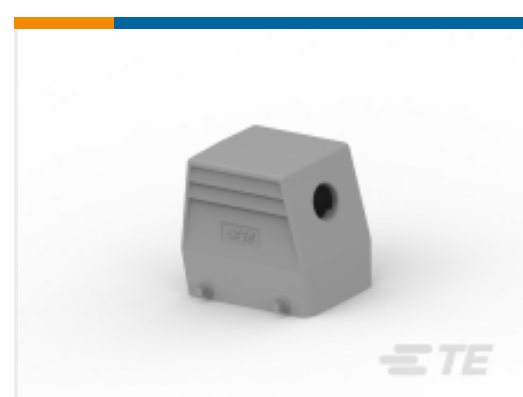
TE 产品编号T1319320120-000 H32A-TS-M20