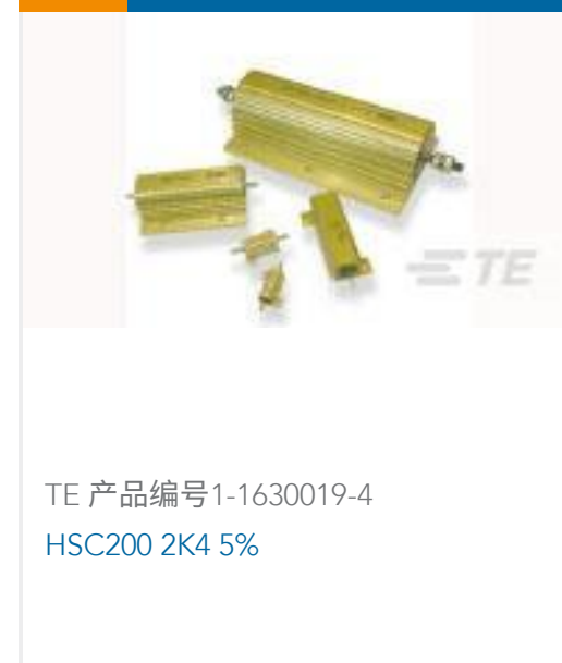
TE 产品编号1-1630019-4 HSC200 2K4 5%