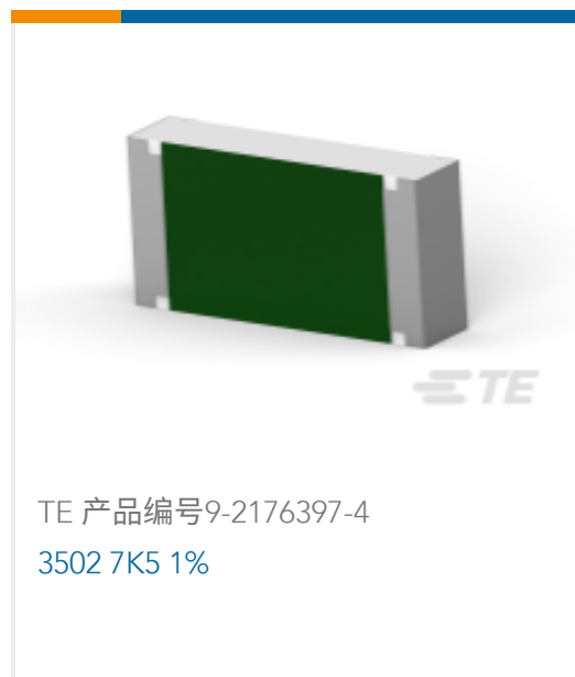
TE 产品编号9-2176397-4 3502 7K5 1%