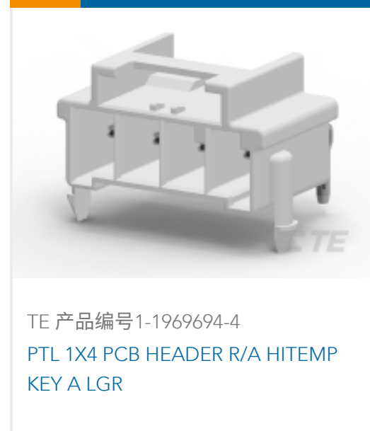
TE 产品编号1-1969694-4 PTL 1X4 PCB HEADER R/A HITEMP KEY A LGR