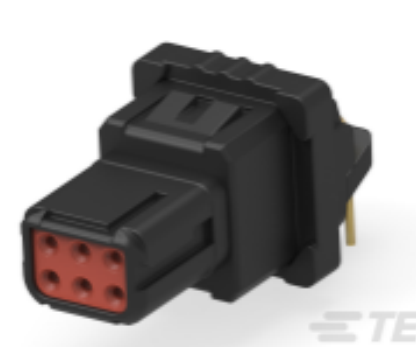
TE 产品编号YD369-B99-AP400000 Rectangular Connectors: 9-Way Panel Mount, 90PCB