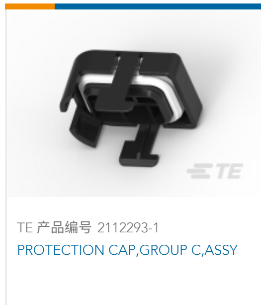
TE 产品编号 2112293-1 PROTECTION CAP, GROUP C, ASSY