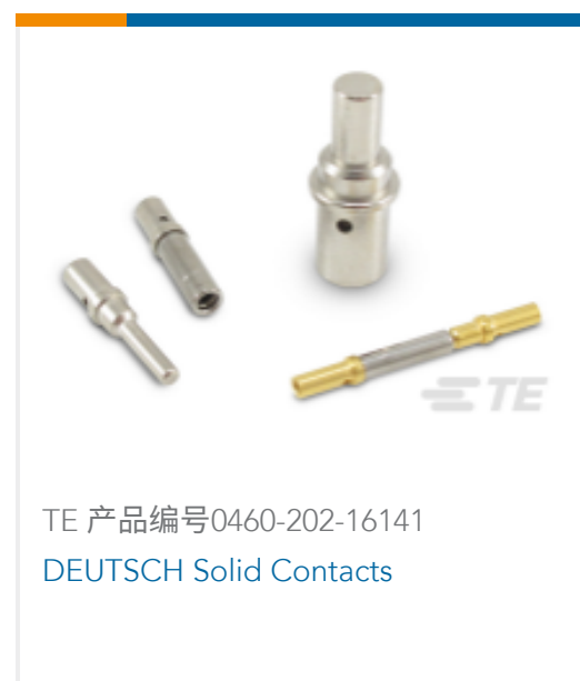
TE 产品编号 0460-202-16141 DEUTSCH Solid Contacts