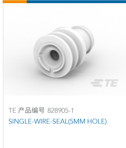
TE 产品编号 828905-1 SINGLE-WIRE-SEAL(5MM HOLE)