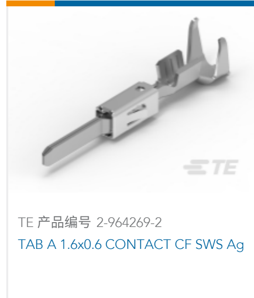
TE 产品编号 2-964269-2 TAB A 1.6x0.6 CONTACT CF SWS Ag