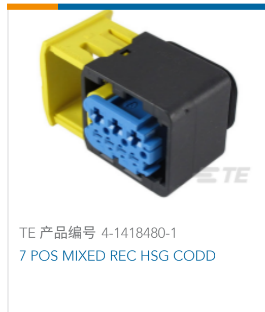
TE 产品编号 4-1418480-1 7 POS MIXED REC HSG CODD