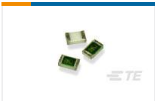
TE 产品编号2-1879215-6 CPF 0402 7K32 0.1% 25PPM 1K RL