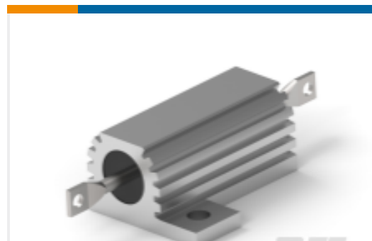
TE 产品编号1879074-8 功率电阻器：铝壳体，75 瓦特