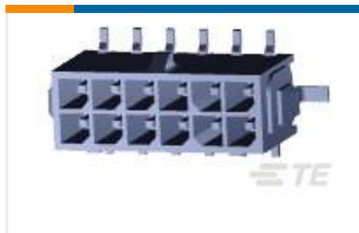
TE 产品编号4-794637-2 12P MICRO MNL ASSY,VRT,SMT LF