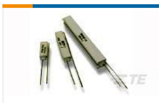
TE 产品编号1-1623729-9 BCHE 17 W 3R3 10%