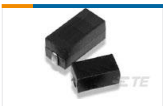
TE 产品编号6-1879021-9 SMW3 68R 5%