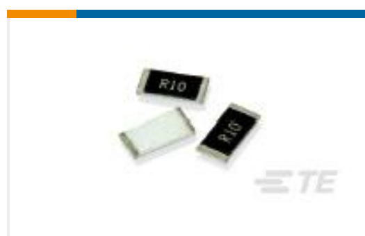
TE 产品编号2176057-7 RLP73V 3A R018 1% 1K RL