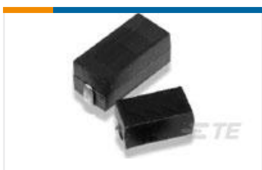
TE 产品编号1-1879011-3 SMF2 680R 5%