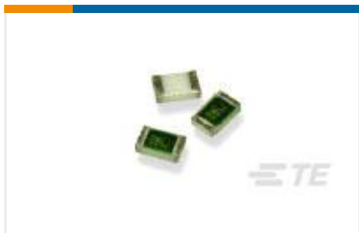
TE 产品编号6-1879215-8 CPF 0402 23K2 0.1% 25PPM 1K RL