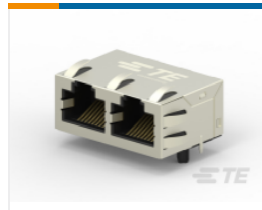
TE 产品编号2301996-1 RJ45 JACK INT.MAG. 10/100 1X2 INV.