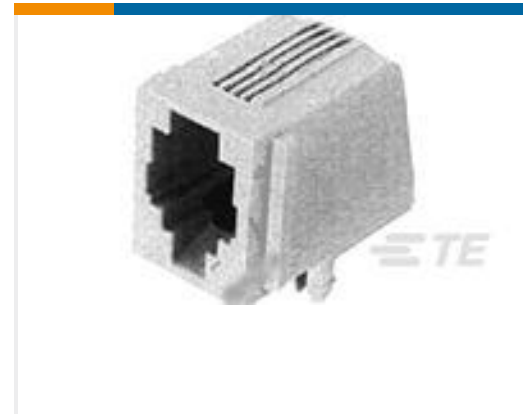
TE 产品编号5520426-4 MJ,R/A,8P