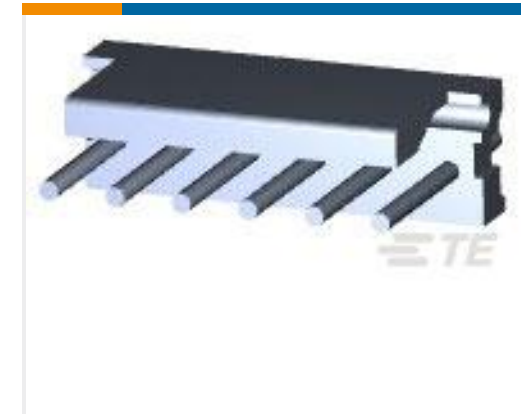
TE 产品编号640388-6 06P MTA156 HDR ASSY RN STR F/L