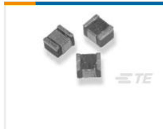
TE 产品编号1-1879023-1 3650 1008 47nH 5% 2K RL