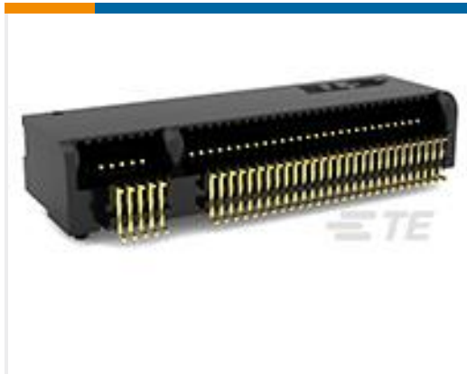
TE 产品编号1-2199230-6 M.2 0.5PITCH 4.2H KEY M 30U AU