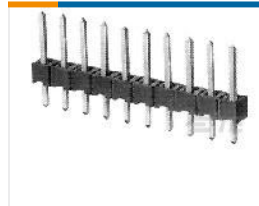
TE 产品编号826629-3 3P AMPMODU II