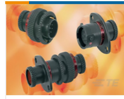
TE 产品编号ASDD208-11PN-973V RECEPT ASSY.2 HOLE. TYPE 2. AS DOUBLE DE