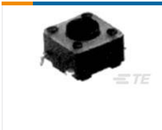
TE 产品编号4-1437565-2 FSM4JSMATR=TACT SWITCH 6X6MIL