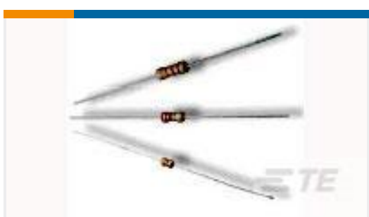
TE 产品编号 2-1623933-7 CFR50 5% 3R9