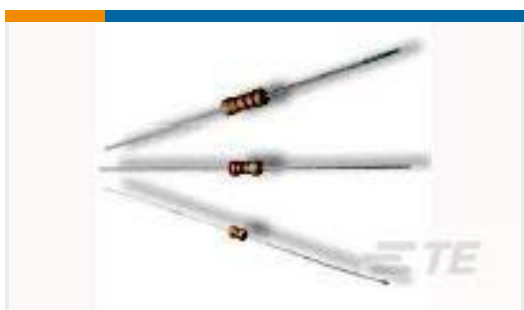
TE 产品编号 6-1623933-5 CFR50 5% 820K