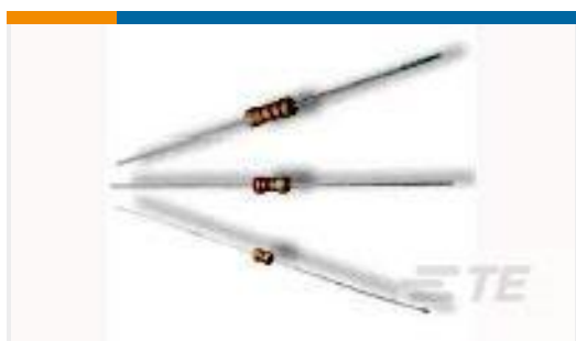
TE 产品编号 6-1623933-4 CFR50 5% 75R