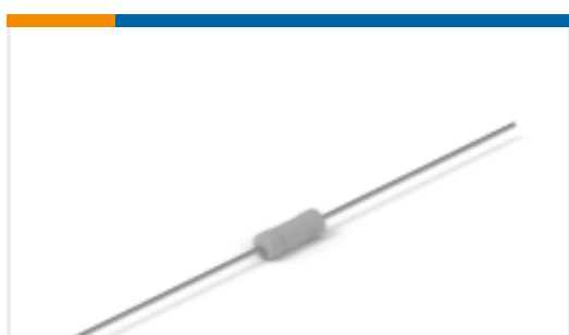
TE 产品编号8-1676123-6 1/2W SM M/OX 5% 3K0