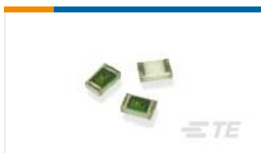
TE 产品编号1676178-2 RN 0805 133R 0.1% 10PPM 1KRL