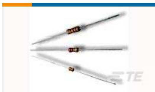
TE 产品编号 5-1623933-8 CFR50 5% 6M8