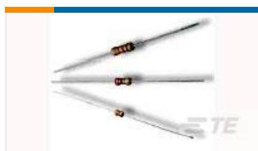
TE 产品编号 1623932-8 CFR50 5% 10K