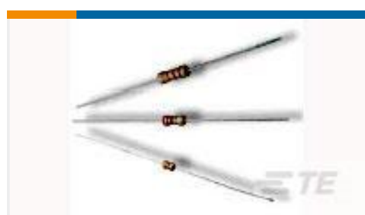
TE 产品编号 6-1623933-8 CFR50 5% 82K