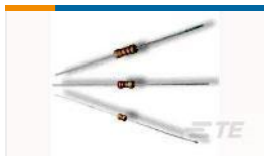
TE 产品编号 3-1623933-5 CFR50 5% 4M7