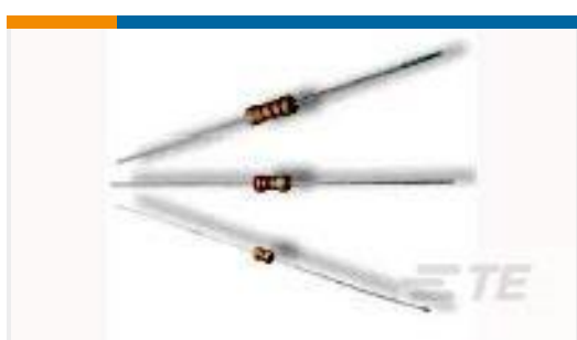
TE 产品编号 2-1623933-5 CFR50 5% 3R3