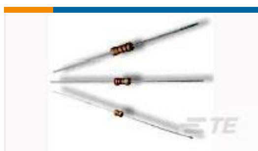
TE 产品编号 2-1623933-1 CFR50 5% 3M3