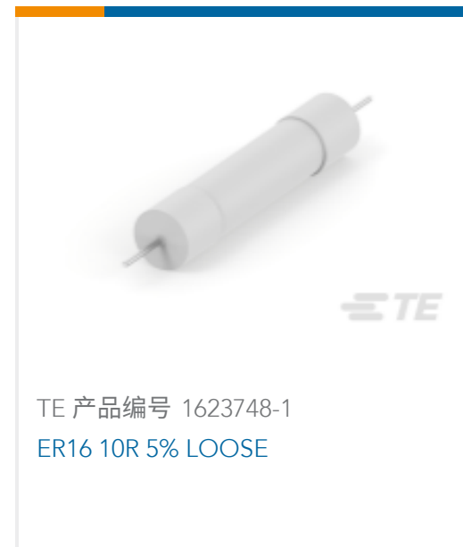
TE 产品编号 1623748-1 ER16 10R 5% LOOSE