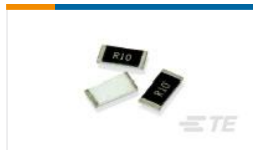
TE 产品编号 2-1879461-5 RL73H 2A R13 1% 1K RL