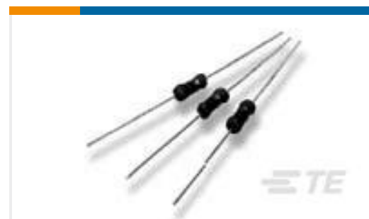
TE 产品编号 1-1625893-3 5W SM M/OX 2% 22R