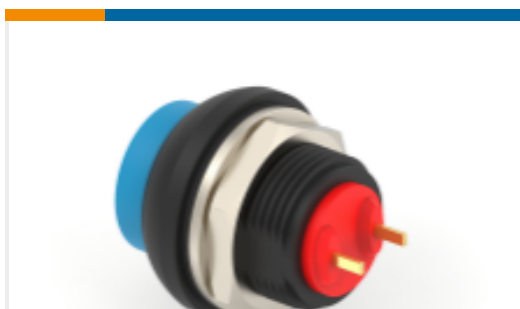
TE 产品编号 2-2329328-0 PB OFF/ON HC BLU M4 TERM. IP68