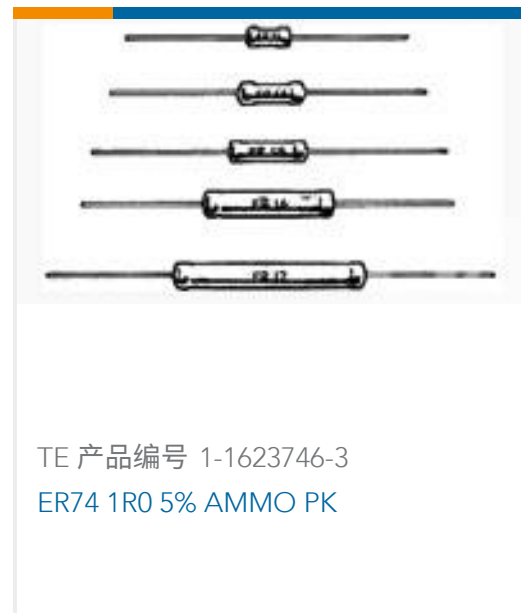
TE 产品编号 1-1623746-3 ER74 1R0 5% AMMO PK