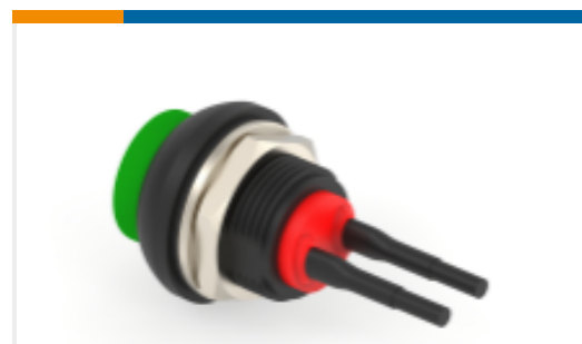
TE 产品编号 2329359-9 PB ON/OFF HC GRE M1 TERM IP68 500MM LHS