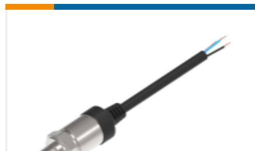
TE 产品编号 20014203-12 PRESS XDCR M325M-000005-250PG