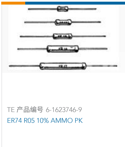
TE 产品编号 6-1623746-9 ER74 R05 10% AMMO PK