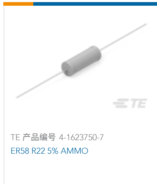
TE 产品编号 4-1623750-7 ER58 R22 5% AMMO