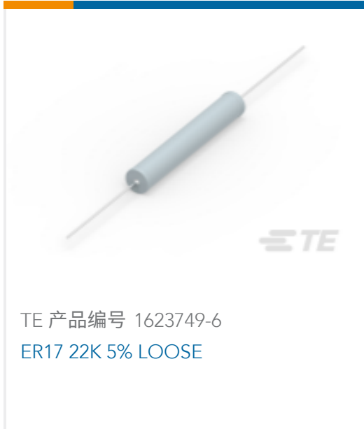
TE 产品编号 1623749-6 ER17 22K 5% LOOSE