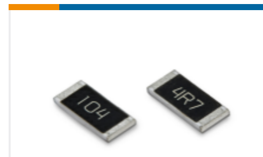
TE 产品编号 2-2176455-5 CPF 0402 7R5 0.1% 25ppm 1K RL