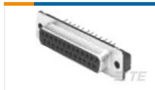
TE 产品编号2-747708-0 25 RCPT SP/FMS BRDLK