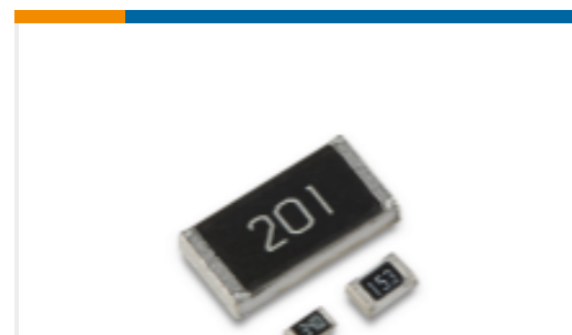
TE 产品编号4-2176325-1 CRGP 0402 22K 1%