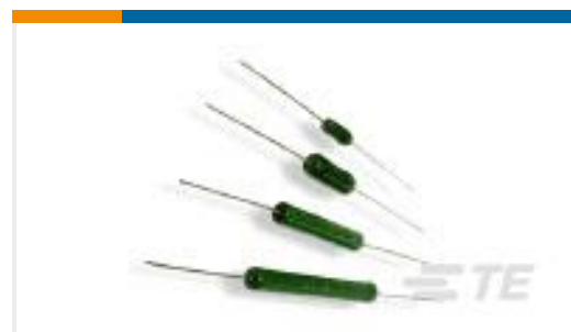
TE 产品编号1-1623774-9 C14 15R 5% (LOOSE)