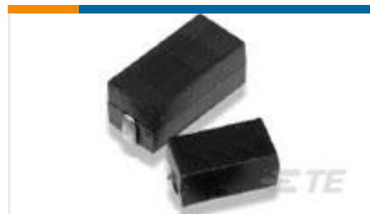
TE 产品编号1879233-1 SMW5 R10 5%