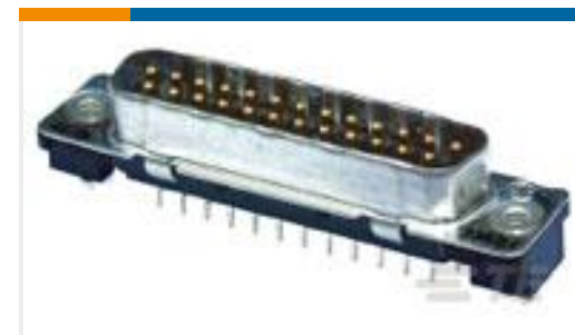
TE 产品编号5750638-1 15 PLUG SP/FMS BRDLK