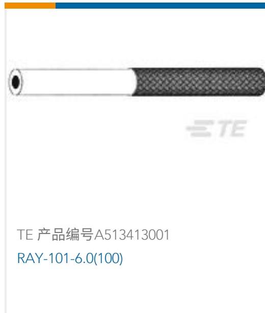
TE 产品编号A513413001 RAY-101-6.0(100)