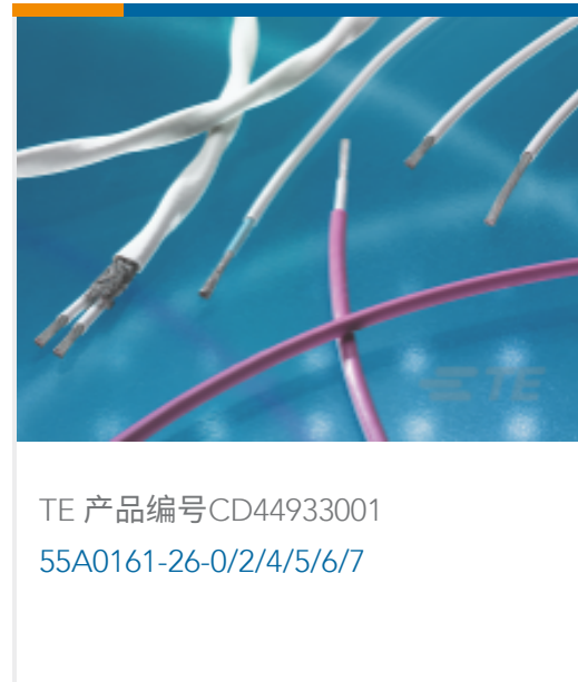
TE 产品编号CD44933001 55A0161-26-0/2/4/5/6/7