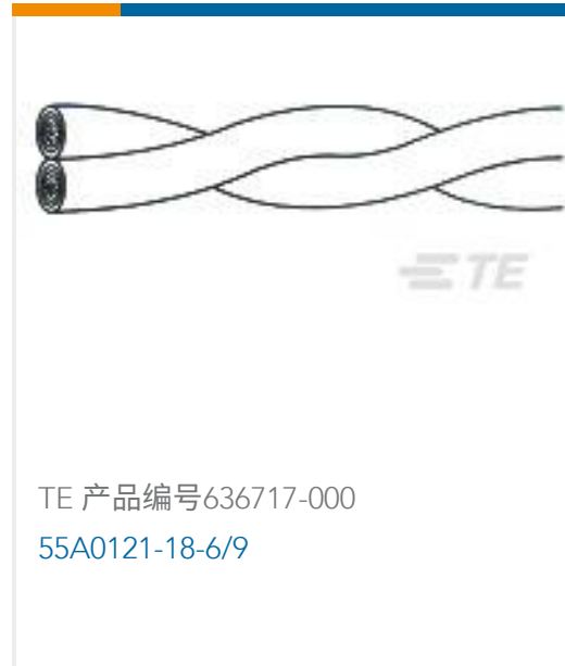
TE 产品编号636717-000 55A0121-18-6/9