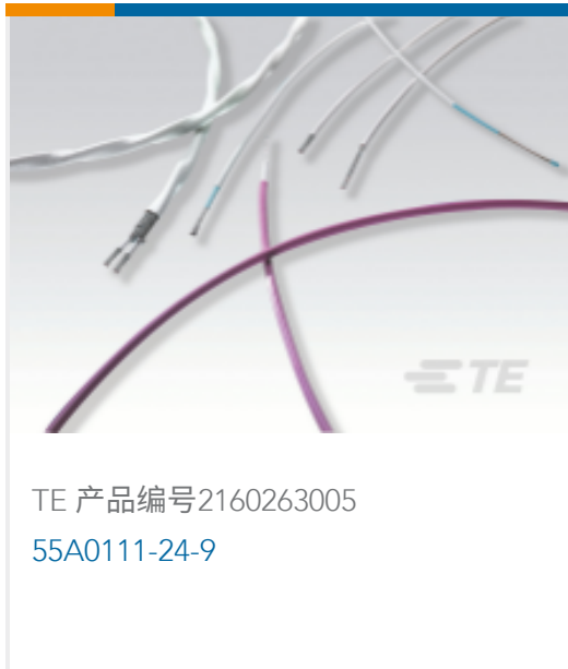
TE 产品编号2160263005 55A0111-24-9