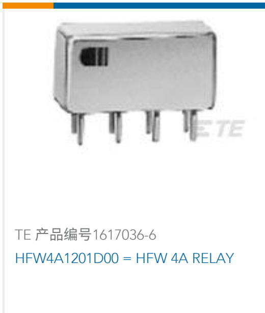
TE 产品编号1617036-6 HFW4A1201D00 = HFW 4A RELAY