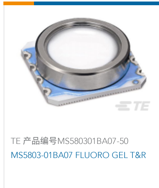
TE 产品编号MS580301BA07-50 MS5803-01BA07 FLUORO GEL T&R