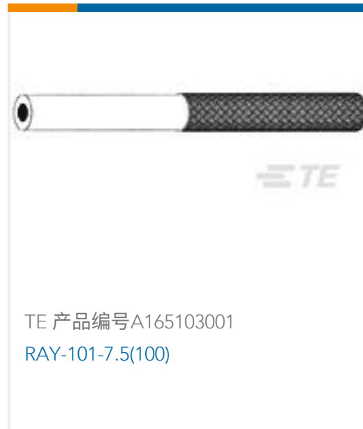
TE 产品编号A165103001 RAY-101-7.5(100)