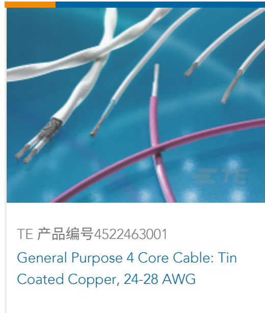
TE 产品编号4522463001 General Purpose 4 Core Cable: Tin Coated Copper, 24-28 AWG