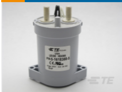
TE 产品编号 2-1618393-6 LEV200H6ANA=RELAY, SPST-NO