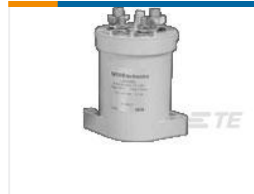
TE 产品编号 1618387-7 LEV200A4NAA=RELAY, SPST-NO