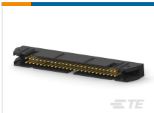
TE 产品编号1658694-7 AMP 锁门通用插头