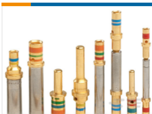
TE 产品编号2560-201-2031L CONT PIN