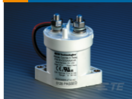
TE 产品编号 2-1618002-0 EV200HJANA=RELAY, SPST-NO WITH