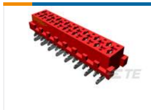
TE 产品编号7-188275-8 MICRO-MATCH SMD FTE