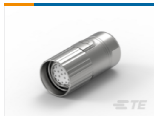
TE 产品编号ASA014N00410235000 623 PLUG