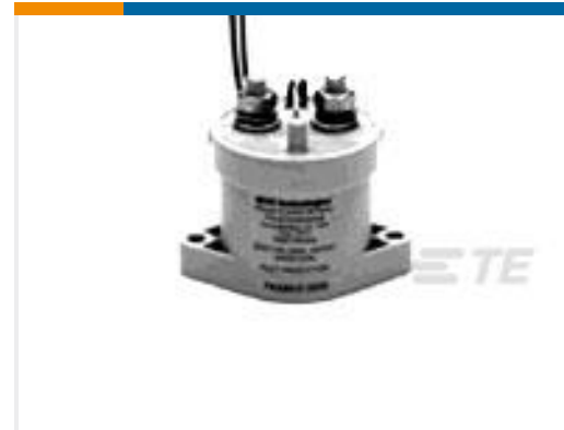
TE 产品编号 1-1618002-9 EV200HDANA=RELAY, SPST-NO