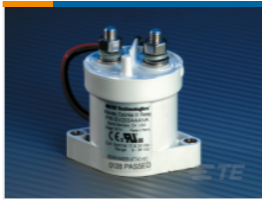
TE 产品编号 1-1618002-1 EV200ADANA=RELAY, EV200 SPST-NO