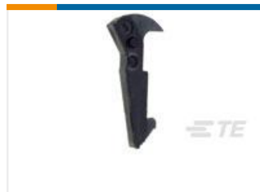
TE 产品编号102320-1 UNIVERSAL HEADER LATCH