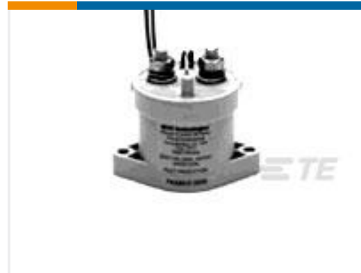
TE 产品编号 1618002-3 EV200A2ANA=RELAY, EV200 SPST-N