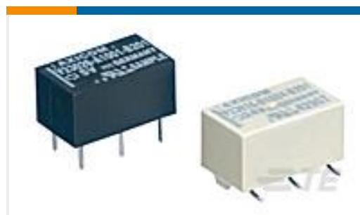
TE 产品编号1393776-7 V23026D1024B201 *X020