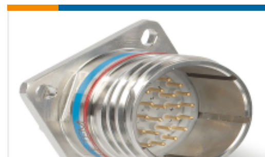
TE 产品编号DTS20W19-11SN RECP ASSY