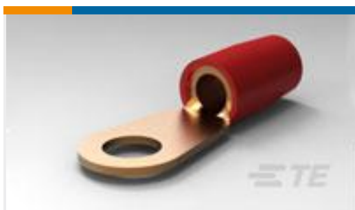
TE 产品编号324082 TERMINAL,T-N R 8 1/4