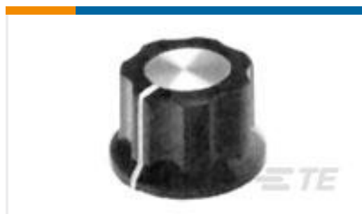
TE 产品编号5-1437624-1 PKES60B1/8=KNOB