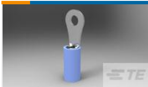
TE 产品编号324159 TERM, RING, PIDG, 16-14, #4