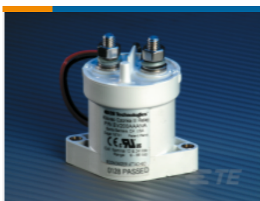
TE 产品编号 1618002-7 EV200AAANA=RELAY, EV200 SPST-N