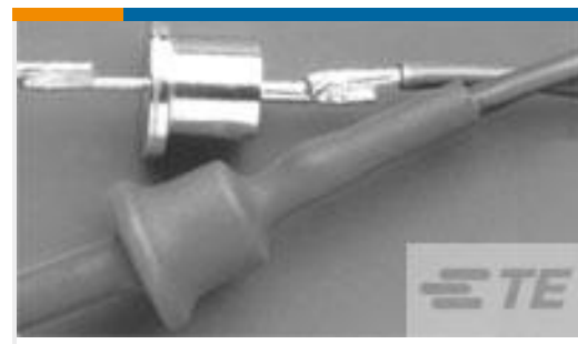
TE 产品编号5677584004 RNF-3000-9/3-0-SP