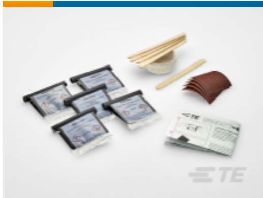
TE 产品编号583393-000 S1125-KIT-5