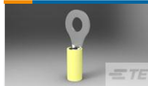
TE 产品编号130205 PIDG RING