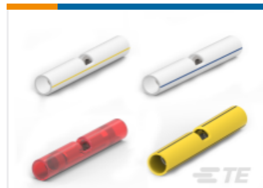
TE 产品编号320570 PIDG Butt Splices