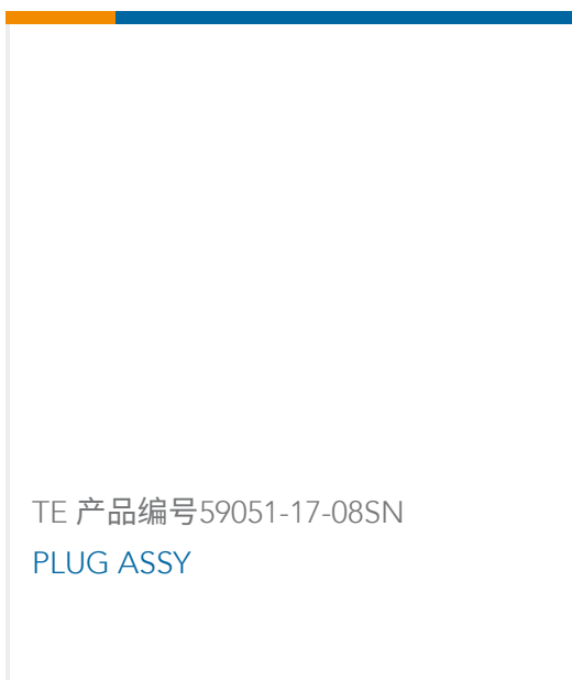
TE 产品编号59051-17-08SN PLUG ASSY