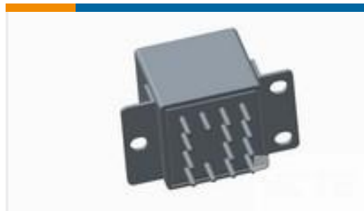
TE 产品编号1-1617805-6 TD228-1001P=TDFO 1SEC M83726/28-1001P