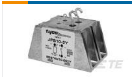
TE 产品编号3-1618382-7 JPS10-2Y = M28750/10-002Y