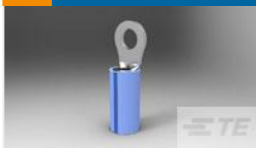
TE 产品编号51864-7 TERMINAL,PIDG R IR 16 10