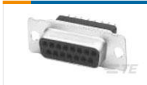
TE 产品编号5745191-1 50 RCPT SP/MS STD