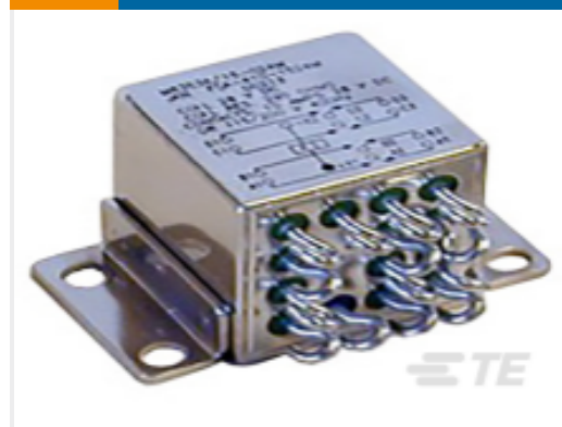
TE 产品编号8-1617805-1 TD228-3001P=TDFO 3 SEC M83726 /28-3001P