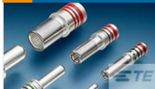
TE 产品编号0662-207-0082 CONT SOC ASSY