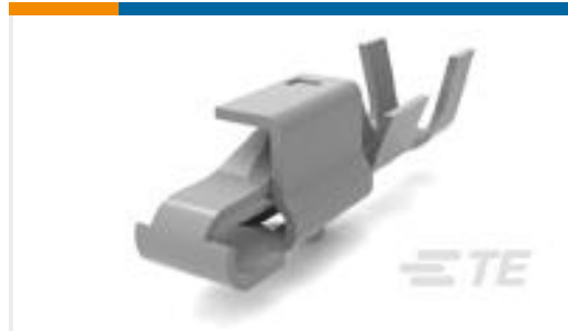
TE 产品编号3-770522-1 SL156 HOODED CONTACT, LP LF