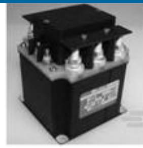
TE 产品编号1616021-6 SA136A=CONTACTOR 3PST N.O. 75