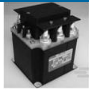
TE 产品编号1616021-6 SA136A=CONTACTOR 3PST N.O. 75