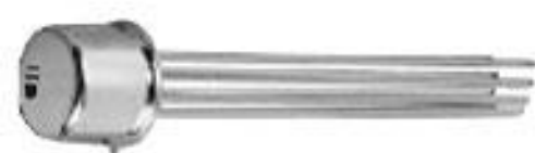
TE 产品编号3-1617118-0 J1MACDD-12XP = M39016/24-028P