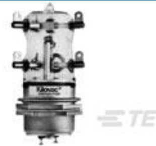
TE 产品编号1-1618273-5 H-16C=RELAY, VACUUM, DPDT