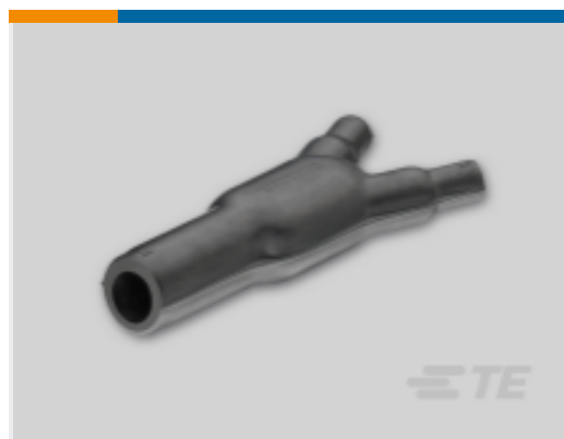
TE 产品编号163549-000 382A034-25/42-0