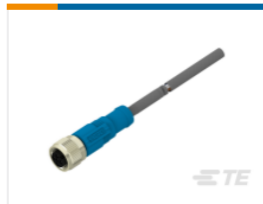
TE 产品编号T4161320008-004 M12 A-Code Pigtail, Female, Straight, Single End Cable