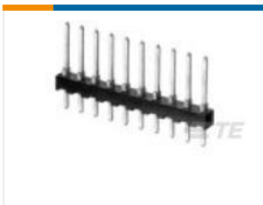
TE 产品编号1-87224-5 15 MODII HDR SRST UNSHRD .100