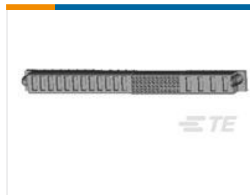
TE 产品编号6450860-2 MBXLE VERT RCPT 4ACP + 48S + 1