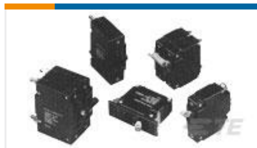
TE 产品编号6-1393252-1 W67-X2Q12-30=M6/M7/M9/W6/W7