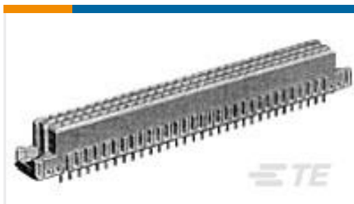
TE 产品编号535090-4 096 EURO TYPE C RECEPT ST ASSY