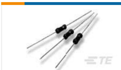
TE 产品编号7-1625890-0 2W SM M/OX 5% 82K