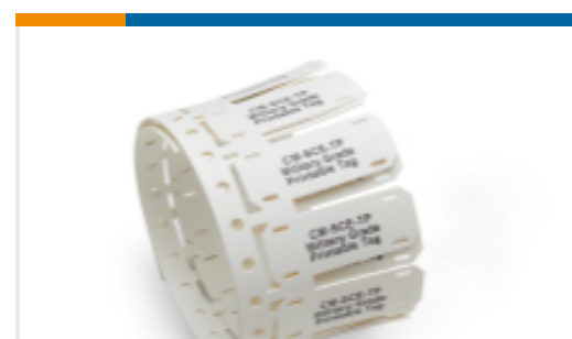
TE 产品编号 EL8598-000 CM-SCE-TP-1/2-6H-3