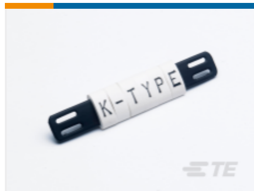
TE 产品编号 CAT-T3437-K1 K-Type Tie-On Markers