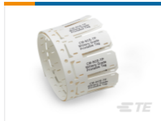
TE 产品编号 CAT-T3437-C6298 CM-SCE-TP Military Grade Markers