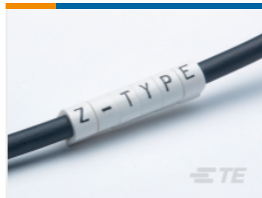
TE 产品编号 CAT-T3437-Z1 Z-Type Push-On Markers