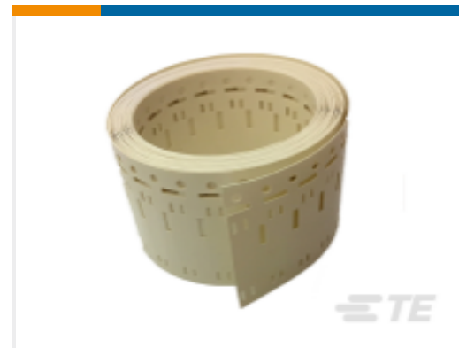
TE 产品编号 CAT-T3437-H85999 High Temperature Markers, HTCM-SCE-TP