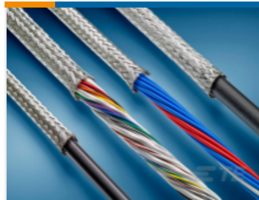
TE 产品编号CQ50483001 RAY-101-7.5(10)