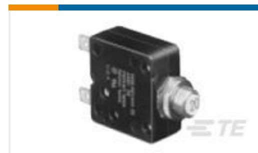
TE 产品编号4-1393249-8 W58-XC4C12A-4=W58