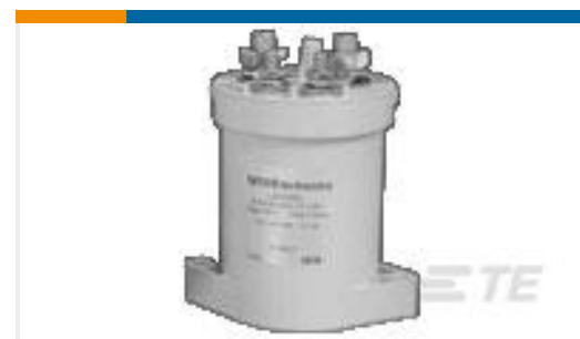
TE 产品编号4-1618388-6 LEV200A5NAA=RELAY, SPST-NO