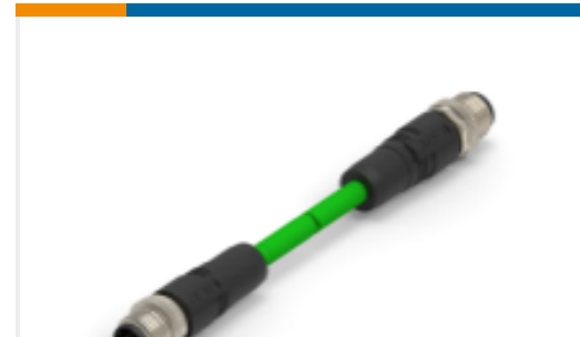
TE 产品编号TAD14745101-005 M12D4-MS-MS-PUR TYPE C GREEN-5.0M