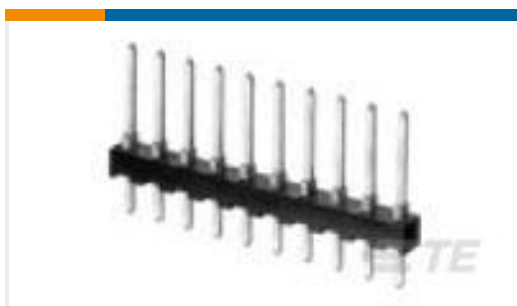
TE 产品编号1-87221-0 11 MODII HDR SRST UNSHRD .150