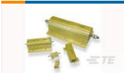
TE 产品编号1-1630012-6 HSC150 240R 5%