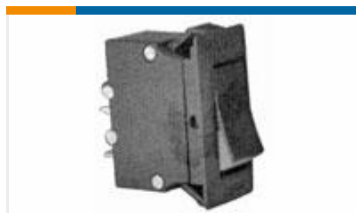
TE 产品编号1423673-6 W51-A121B1-15=CKTBKR,THERM,ROC