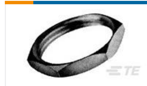
TE 产品编号1-329631-2 JAM NUT, PLATED