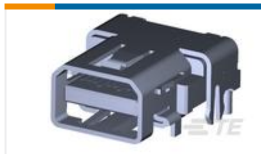
TE 产品编号2129320-3 Mini Displayport Reverse Offset