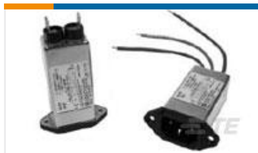
TE 产品编号2-6609006-2 3EJT1=F8134