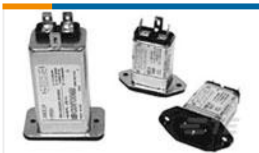
TE 产品编号6609006-1 1EEJ1=F8005 S0