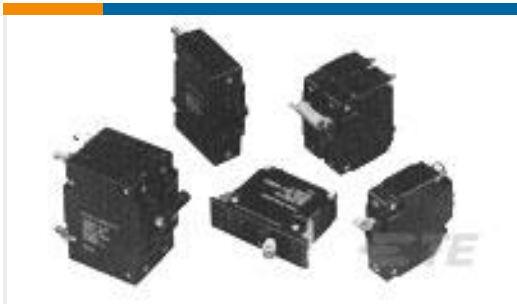
TE 产品编号6-1393252-1 W67-X2Q12-30=M6/M7/M9/W6/W7