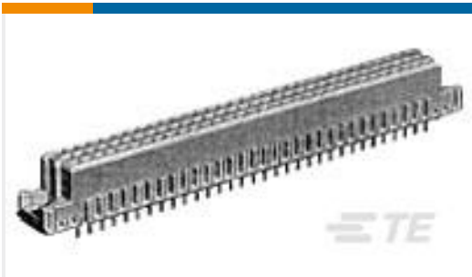
TE 产品编号535090-4 096 EURO TYPE C RECEPT ST ASSY