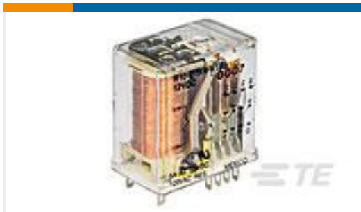
TE 产品编号1-1393767-5 R10-E2X2-V700=R10