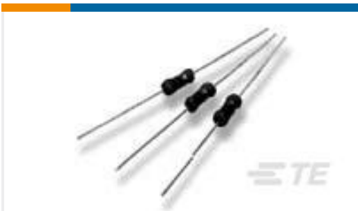
TE 产品编号7-1625890-0 2W SM M/OX 5% 82K