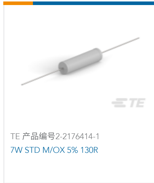
TE 产品编号2-2176414-1 7W STD M/OX 5% 130R