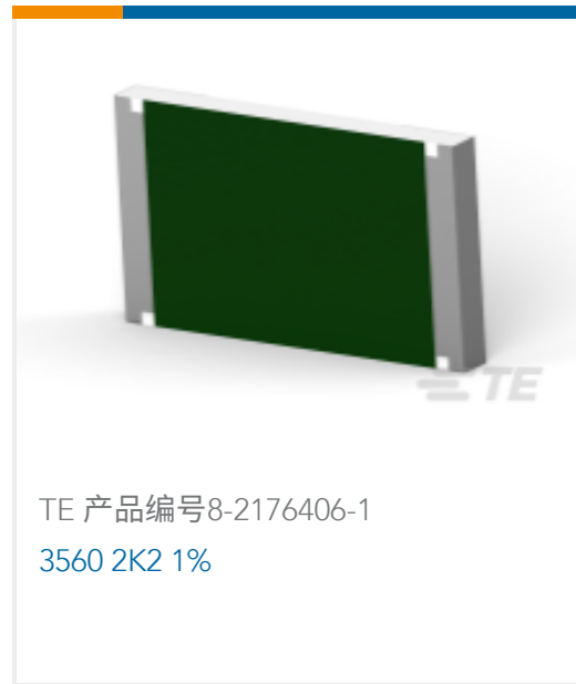
TE 产品编号8-2176406-1 3560 2K2 1%