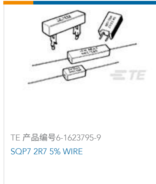
TE 产品编号6-1623795-9 SQP7 2R7 5% WIRE