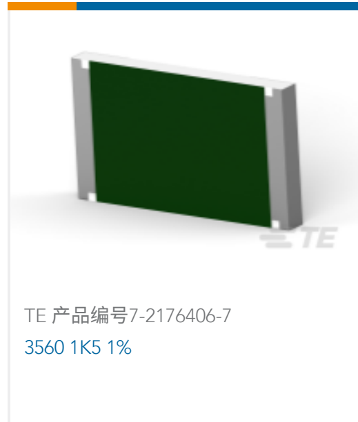
TE 产品编号7-2176406-7 3560 1K5 1%