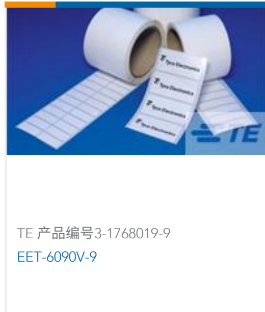
TE 产品编号3-1768019-9 EET-6090V-9