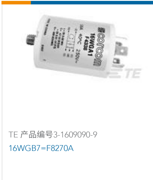
TE 产品编号3-1609090-9 16WGB7=F8270A