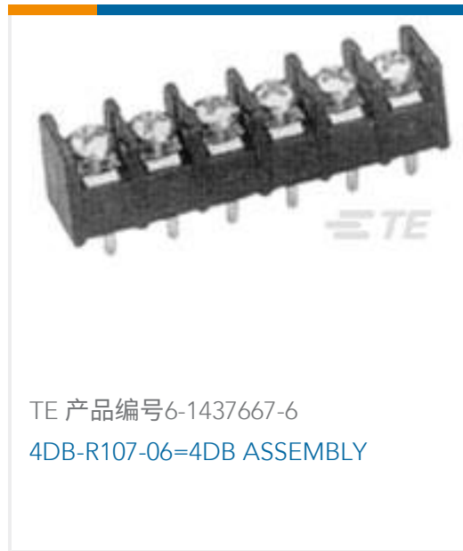
TE 产品编号6-1437667-6 4DB-R107-06=4DB ASSEMBLY