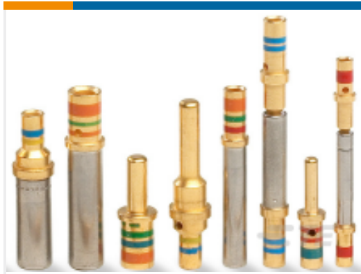
TE 产品编号2562-201-2031L CONT SOC ASSY