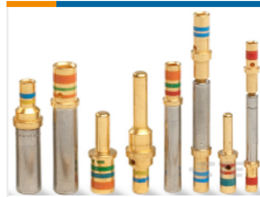
TE 产品编号0662-207-1282 CONT SOC ASSY