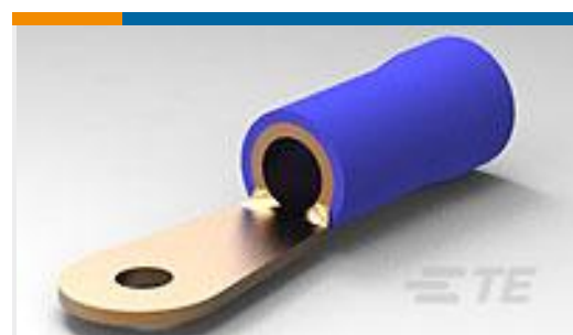
TE 产品编号52042-2 TERMINAL,R PG 6 8