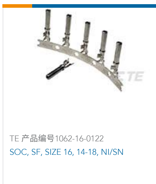
TE 产品编号1062-16-0122 SOC, SF, SIZE 16, 14-18, NI/SN