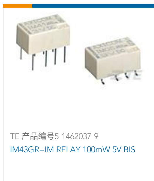
TE 产品编号5-1462037-9 IM43GR=IM RELAY 100mW 5V BIS