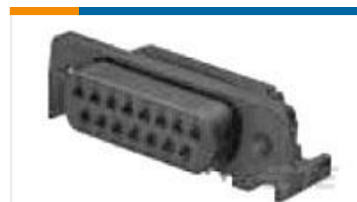
TE 产品编号5745395-2 HD-20 RCPT 9P RA 318 FFSCRLK