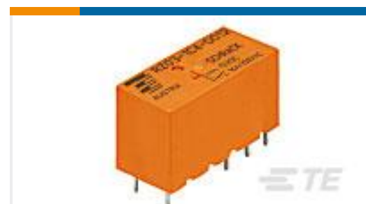
TE 产品编号2-1415899-2 RZ03-1C4-D012