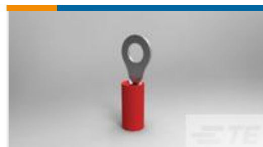
TE 产品编号2-320554-1 PIDG R 22-16 COMM 22-18 MIL 8