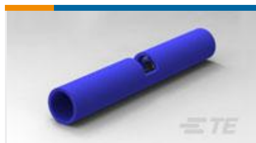
TE 产品编号327583 SPLICE BUTT PIDG 16-14/22-18