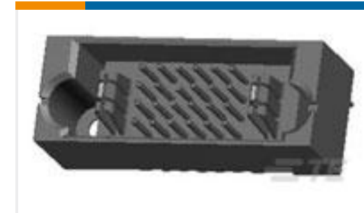
TE 产品编号6450820-2 MBXLE VERT HDR 1P+24S+1P