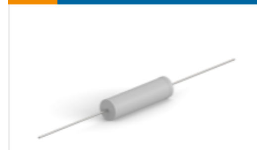
TE 产品编号7-2176414-5 7W STD M/OX 5% 24K