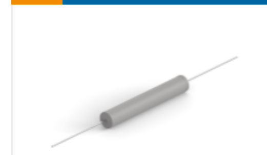
TE 产品编号4-2176416-1 9W STD M/OX 5% 2K4