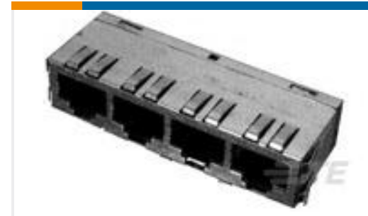
TE 产品编号5406281-3 MJ ASSY,4P,8POS,SH,RVPGT,CAT5