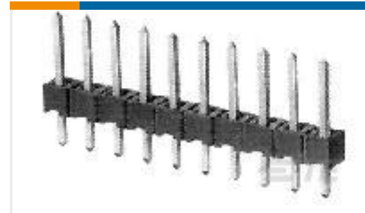
TE 产品编号3-825433-2 MOD 2 PINHDR 1X32P.