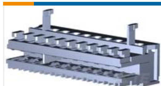
TE 产品编号7-1534796-0 AMP DUOPLUG MK2 CONNECTOR 10P