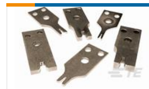
TE 产品编号6-456408-4 CRIMPER, WIRE .110 F PREMIUM