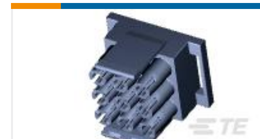
TE 产品编号2029370-1 09P UMNL-II REAR, TW-N-LK-CAP