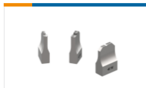
TE 产品编号1633922-4 ANVIL, COMBINATION