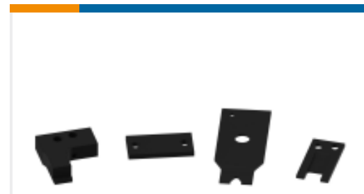
TE 产品编号813071-1 SHEAR, UPPER