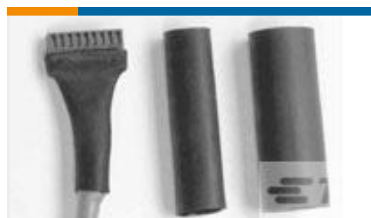
TE 产品编号2951516014 DWP-125-1/4-0-11N