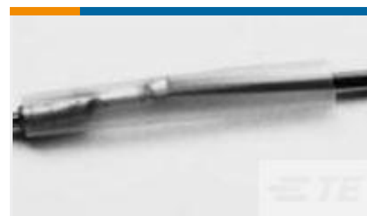
TE 产品编号CV3440-000 RW-175-3/8-X-1.5IN