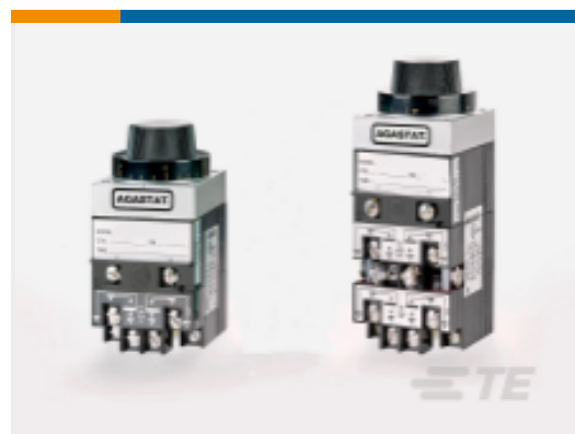
TE 产品编号 1423157-5 7012AC=RLY,STD,ON,2P,120VAC,15