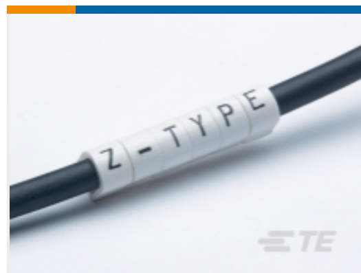
TE 产品编号 EC0437-000 06153411