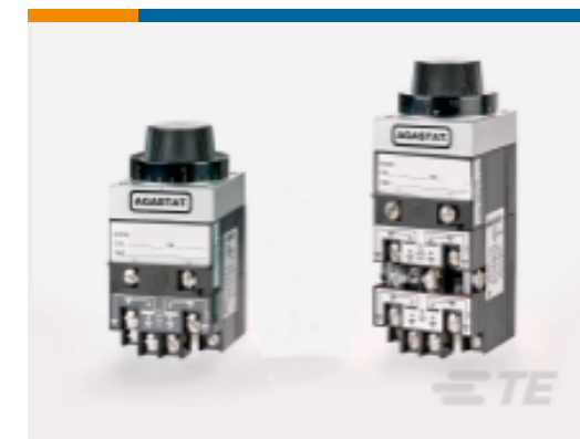
TE 产品编号 1755170-1 7022OCIM=RLY,STD,OFF,2P,24V,15S,I, M