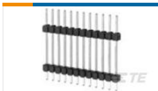
TE 产品编号9-146462-0 40 MODII HDR SRST UNSHRD STKG