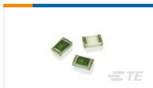
TE 产品编号5-2176091-1 RP 2A 0.25W 191R 0.1% 25PPM 1K RL