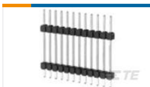
TE 产品编号4-146468-0 40 MODII HDR SRST UNSHRD STKG