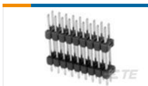
TE 产品编号4-146494-0 80 MODII HDR DRST UNSHRD STKG