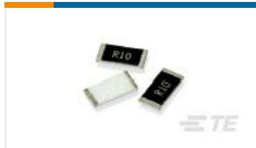
TE 产品编号1-2176057-8 RLP73N 3A R051 1% 1K RL