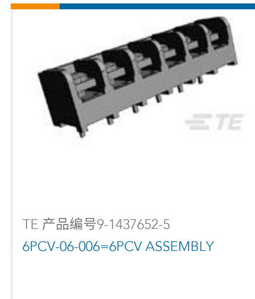
TE 产品编号9-1437652-5 6PCV-06-006=6PCV ASSEMBLY