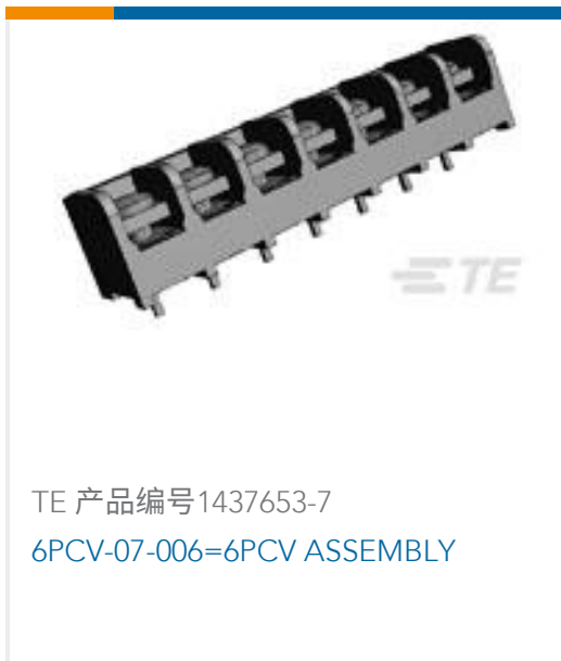
TE 产品编号1437653-7 6PCV-07-006=6PCV ASSEMBLY