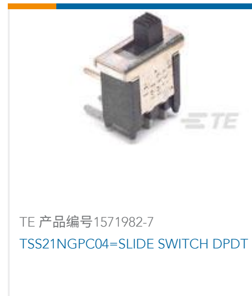
TE 产品编号1571982-7 TSS21NGPC04=SLIDE SWITCH DPDT