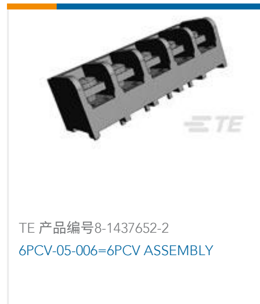
TE 产品编号8-1437652-2 6PCV-05-006=6PCV ASSEMBLY