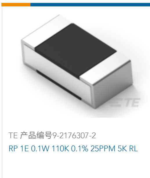
TE 产品编号9-2176307-2 RP 1E 0.1W 110K 0.1% 25PPM 5K RL