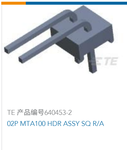
TE 产品编号640453-2 02P MTA100 HDR ASSY SQ R/A