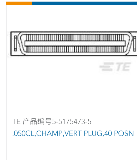
TE 产品编号5-5175473-5 .050CL, CHAMP, VERT PLUG, 40 POSN