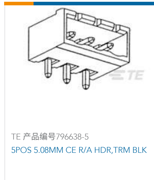
TE 产品编号796638-5 5POS 5.08MM CE R/A HDR, TRM BLK