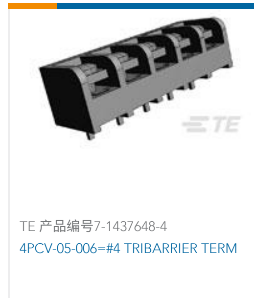
TE 产品编号7-1437648-4 4PCV-05-006=#4 TRIBARRIER TERM