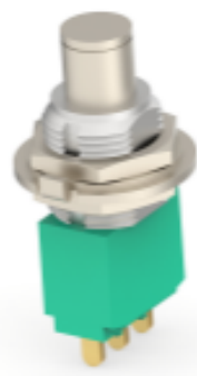
TE 产品编号 4-1437567-9 MPG106D=(MSPG) SWITCH PUSHBUTT