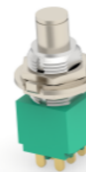
TE 产品编号 5-1437567-3 MPG206R=(MSPG) SW PUSHBUTTON