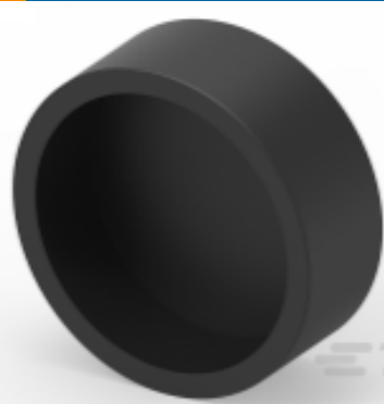
TE 产品编号 7-1437627-1 C90=C-9 BLACK