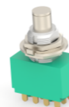
TE 产品编号 5-1437567-8 MPG406R=(MSPG) SW PUSHBUTTON