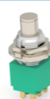
TE 产品编号 5-1437567-1 MPG206N=SWITCH PUSHBUTTON