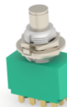
TE 产品编号 5-1437567-7 MPG406N=(MSPG) SW PUSHBUTTON