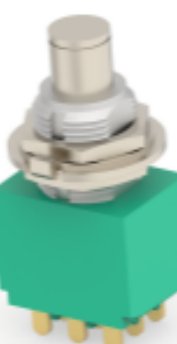
TE 产品编号 5-1437567-5 MPG306D=(MSPG) SW PUSHBUTTON