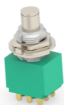
TE 产品编号 5-1437567-6 MPG306F=(MSPG) SW PUSHBUTTON