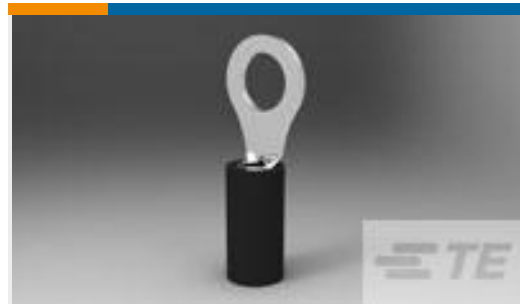
TE 产品编号50845-2 TERMINAL,PIDG PTFE R 12-10 10