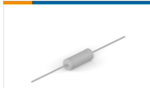
TE 产品编号4-2176412-6 5W XSM M/OX 5% 390R