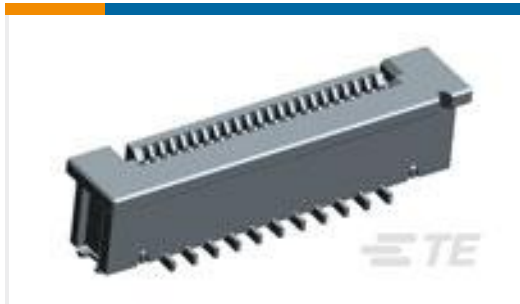
TE 产品编号1734742-6 .5 FPC VT ZIF Type-A 6 CONT