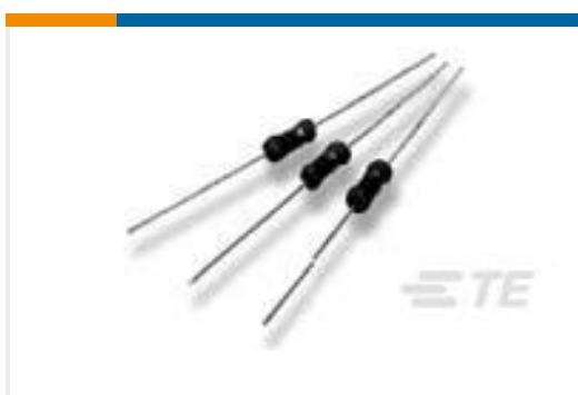
TE 产品编号3-1625890-7 2W SM M/OX 5% 27R