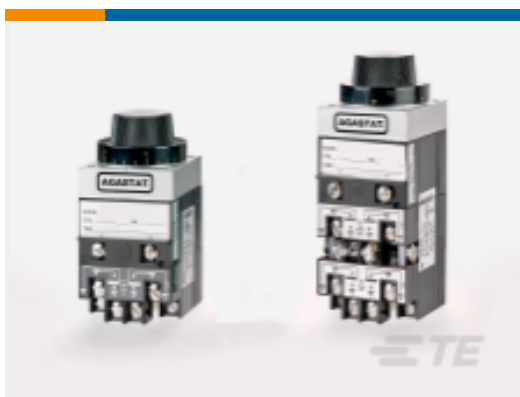
TE 产品编号 1-1423162-8 7022AK=RLY,STD,OFF,2P,120VAC,1