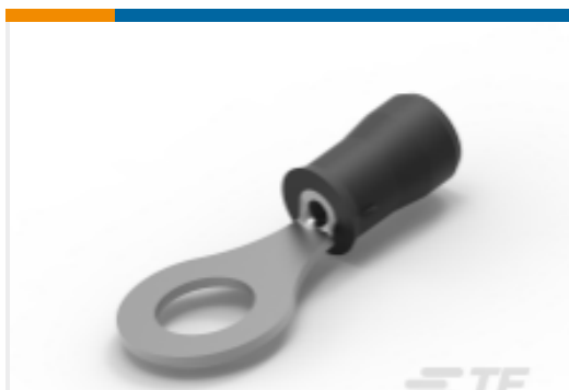
TE 产品编号326882 PIDG Ring Tongue Terminals