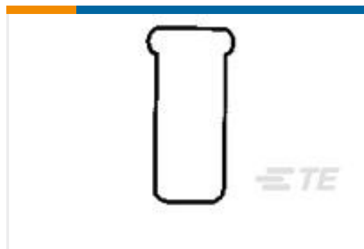
TE 产品编号328308 SPARE WIRE CAP,BLU, 16-14 AWG