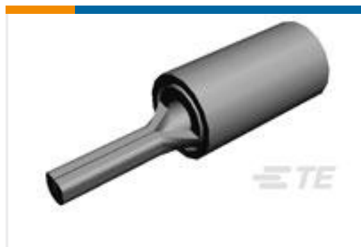
TE 产品编号165172 PIDG WIRE PIN