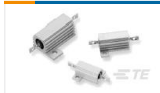
TE 产品编号5-1879075-3 THS25 5K6 5%