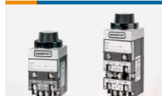
TE 产品编号1437493-5 7012WHV=96V DC 3-30 MINS