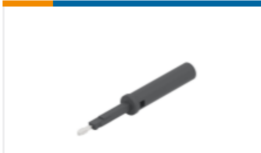
TE 产品编号1SNK900205R0000 TP4