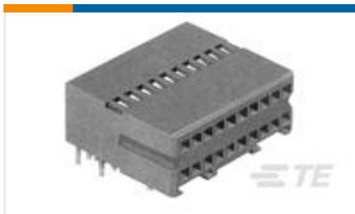
TE 产品编号103911-4 50 SYSTEM 50 RCPT ASSY DRRA