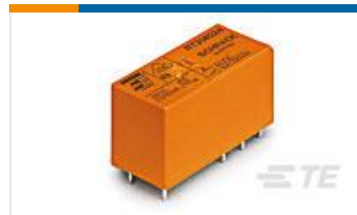
TE 产品编号8-1393238-7 RTD34615