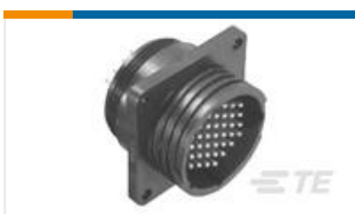
TE 产品编号213855-1 CPC RECPT ASSEMBLY SIZE 17-16