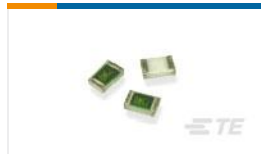
TE 产品编号3-1625868-0 RP 2A 0.25W 10R7 0.1% 25PPM 1K RL