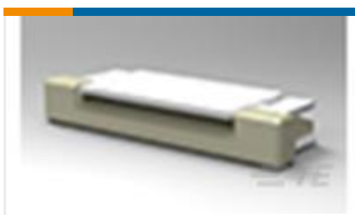
TE 产品编号4-1734839-4 FPC CONN. 0.5MM PITCH T/C,44P