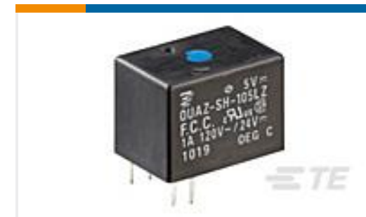
TE 产品编号5-1419145-4 OUAZ-SS-106L,900