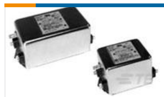
TE 产品编号6609051-1 6VG1=F7401 S0