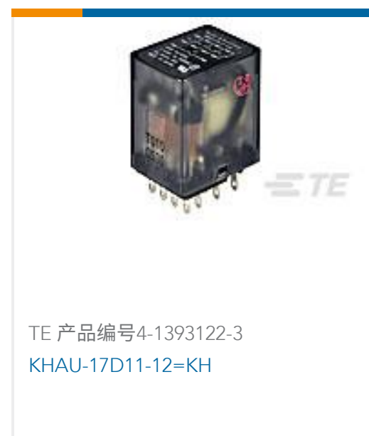
TE 产品编号4-1393122-3 KHAU-17D11-12=KH