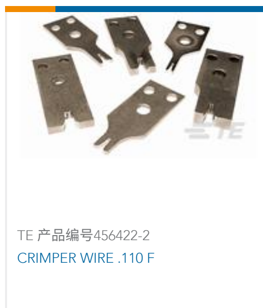
TE 产品编号456422-2 CRIMPER WIRE .110 F