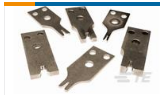
TE 产品编号8-904741-3 CRIMPER, INSUL "O" (.170")