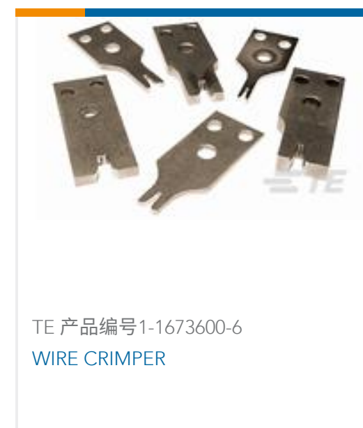
TE 产品编号1-1673600-6 WIRE CRIMPER