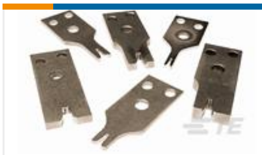
TE 产品编号3-1490019-3 CRIMPER, WIRE (.094" 'F')