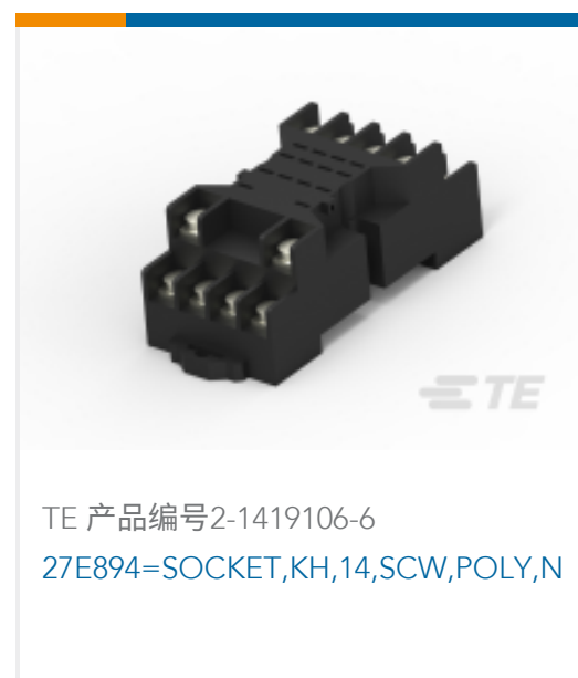
TE 产品编号2-1419106-6 27E894=SOCKET, KH, 14, SCW, POLY, N